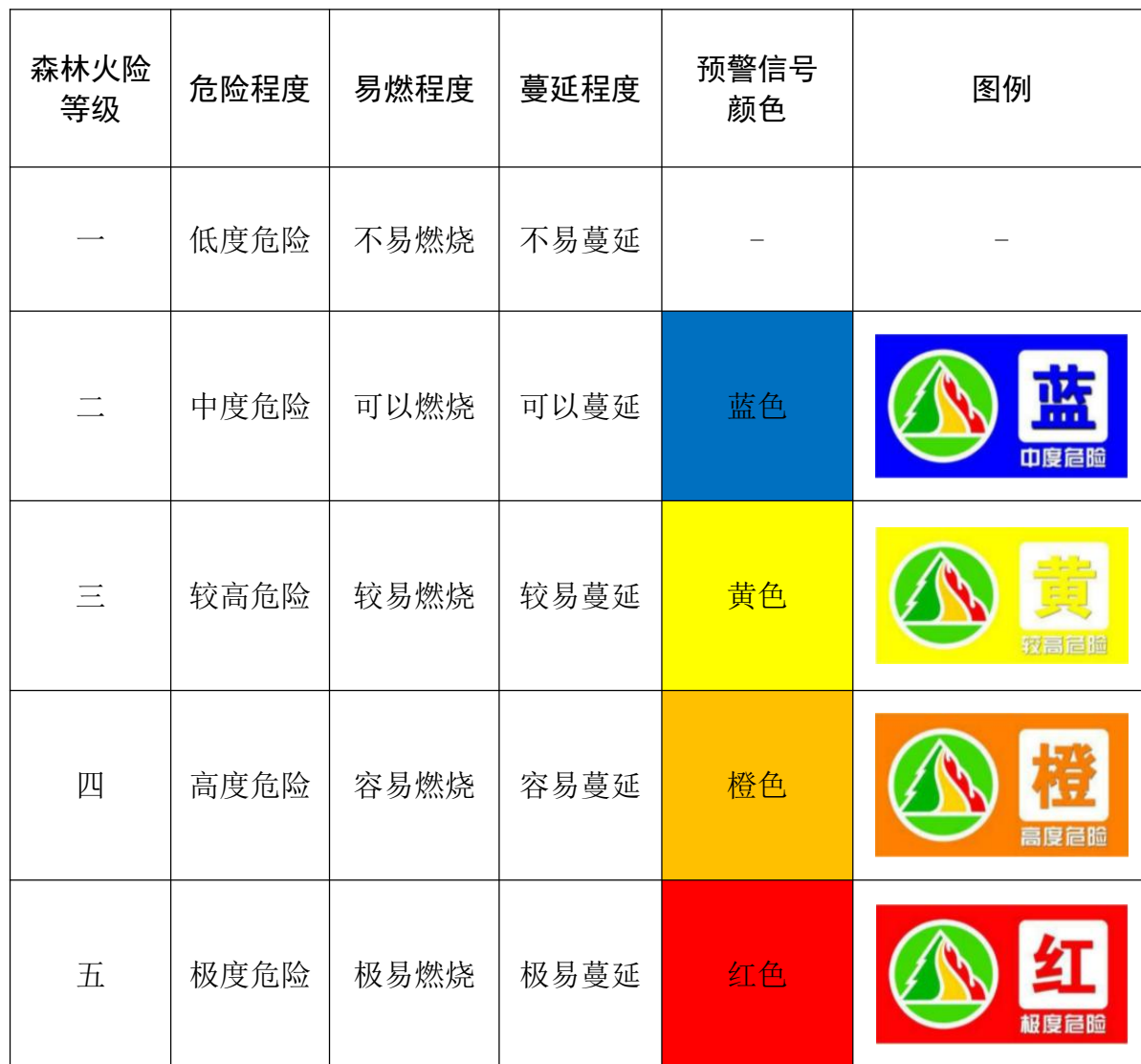
森林火险等级与预警信号对应关系表