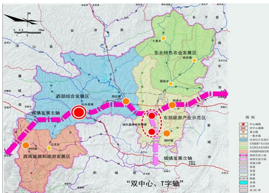
图 2-1 沁水县县域空间布局结构图

以端氏、嘉峰为核心，包含郑村镇、胡底乡的工业集中区，相应整合上述区域相关资源，统一规划，合理布局，共同发力，超常规发展煤层气主导产业，最大程度发挥煤层气前向关联和后向关联效应。大力支持低碳循环发展，在煤层气、光伏、风能、瓦斯、低热值、余热、余气等新能源领域的应用。围绕煤炭、煤层气，大力发展生产性服务业，相应配套相关商贸、物流及生活服务业。力争到“十三五”末，煤层气产业总部基地基本建成，“气化沁水”目标基本实现，力争成为全国煤层气开发利用先行区、示范区。