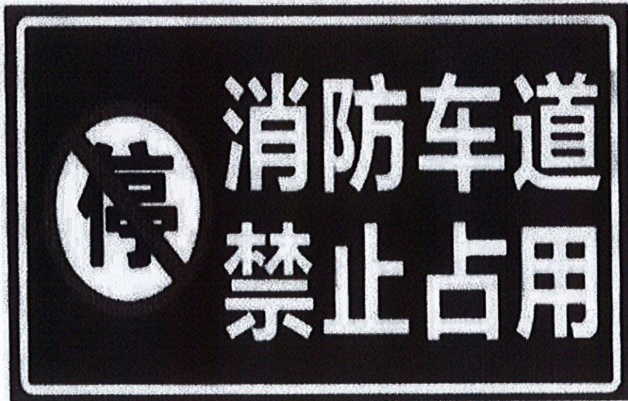
图3: 消防车通道禁止占用警示牌示例