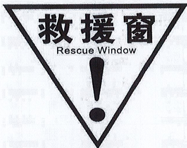
图5 消防救援窗口标识示例

规定，厂房、仓库、公共建筑的外墙应在每层的适当位置设置可供消防救援人员进入的窗口。供消防救援人员进入的窗口的净高度和净宽度均不应小于 1.0m，下沿距室内地面不宜大于 1.2m，间距不宜大于 20m 且每个防火分区不应少于 2 个，设置位置应与消防车登高操作场地相对应。窗口的玻璃应易于破碎，并应设置可在室外易于识别的明显标志，标志示例见图 5。